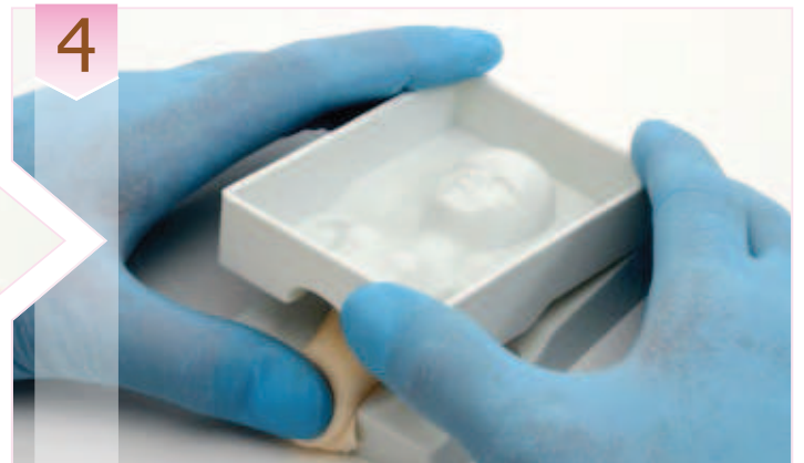
4. Presionar con fuerza los 2 moldes, para que salga la pasta sobrante y eliminar el exceso.