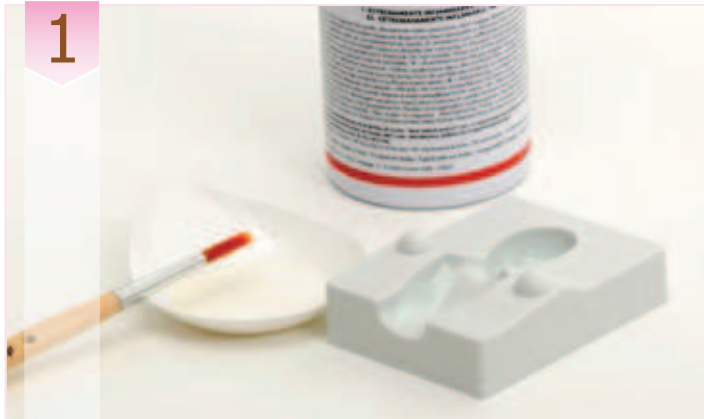
1. Rociar ligeramente la superficie del molde con el spray desmoldeante (cód. 24719). Evitar el uso de grasa sólida o almidón de maiz porque podrían cubrir los detalles del molde.