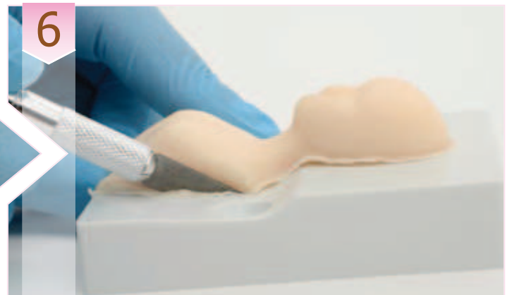
6. Con cuidado, usar un cuchillo afilado para quitar el sobrante de paste de alrededor del punto de unión de la figura.