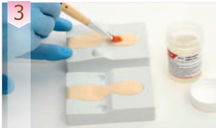
3. Agregar más pasta, hasta rellenar un poquito más de lo necesario para la parte frontal del molde. Hacer lo mismo con la parte posterior del molde. Humedecer ambas capas de pasta con la cola comestible (cód. 24125) y presionar juntas las dos mitades del molde.