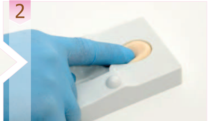
2. Cabeza y busto. Presionar con fuerza una pequeña porción de pasta en el interior del molde, en la zona de la cara, hasta alcanzar los lados del molde.